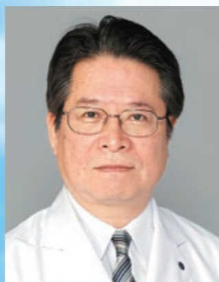
上尾中央総合病院